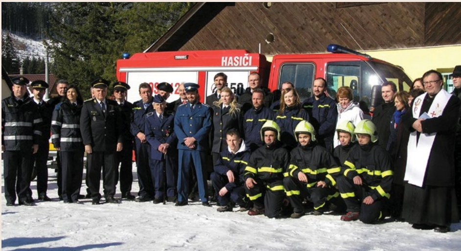
Obr. č. 6 Odovzdanie novej hasičskej techniky (2015)

hravým spôsobom mohli oboznámiť s činnosťou hasičov a vyskúšať si niektoré hasičské zručnosti ako rýchlosť, vytrvalosť a odvahu. To sú dôležité vlastnosti dobrého hasiča.