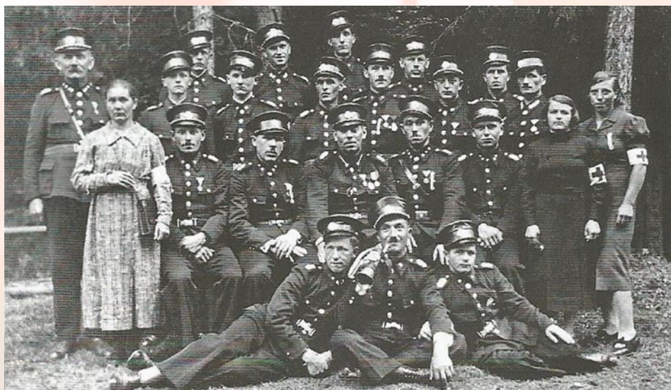
Obr. č. 3 Hasičský zbor okolo roku 1940

Koncom 90-tych rokov bola „kačena“ nahradená cisternou Tatra 148, pre ktorú bolo potrebné predĺžiť požiarnu zbrojnicu. Okolo roku 2002 bola vtedy už poškodená Tatra 148 vymenená za Aviu A30 - valník. Toto vozidlo