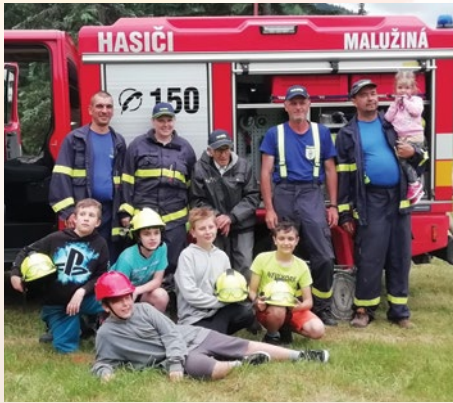
Obr. č. 8 Juniáles 2023 – „železný hasič“

95 výročie založenia DHZ si obec pripomenula pri tohtoročnom Juniálese programom pre deti s názvom „železný hasič“. Deti sa