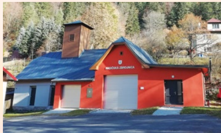
Obr. č. 7 Hasičská zbrojnica po rekonštrukcii (2021)

V roku 2016 získala obec nové hasičské auto Iveco CAS15 a protipovodňový vozík. V rokoch 2019-2020 bola s finančným príspevom Ministerstva vnútra Slovenskej republiky zrekonštruovaná hasičská zbrojnica.