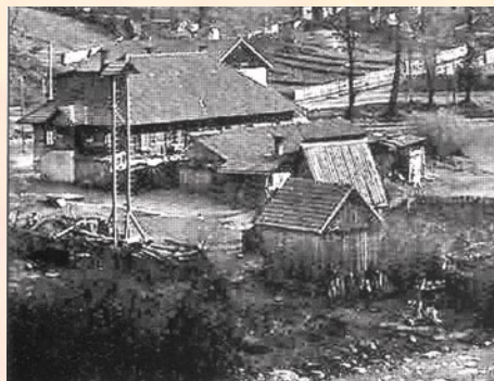
Obr. č. 2 Hasičská zbrojnica s vysokou vežou na sušenie hadíc (1934)