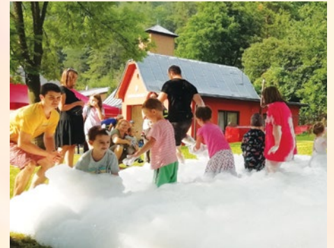
Obr. č. 9 Penová párty (2023)

hravým spôsobom mohli oboznámiť s činnosťou hasičov a vyskúšať si niektoré hasičské zručnosti ako rýchlosť, vytrvalosť a odvahu. To sú dôležité vlastnosti dobrého hasiča.