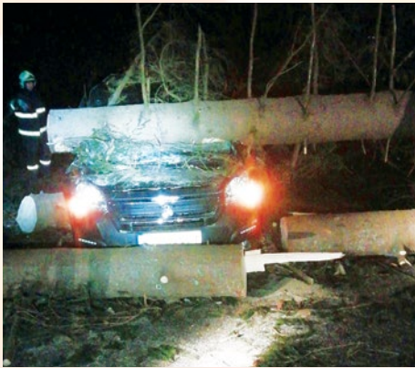
Obr. č. 5 Technický zásah po veternej kalamite na ceste I/72 (2019)