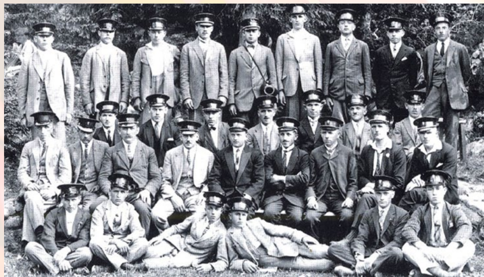
Obr. č. 1 Zakladatelia hasičského zboru v Malužinej, 21.10.1928

Stanovy tohto hasičského spolku, ktorý mal v roku 1932 názov Dobrovoľný ohňoochranný