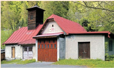
Obr. č. 4 Hasičská zbrojnica postavená okolo roku 1953 po niekoľkých úpravách (2013)

v roku 2007 predala obec bez zabezpečenia náhrady. Na dlhé obdobie tak ostal jediným dopravným prostriedkom pre prevoz požiarnej techniky obecný traktor Zetor.