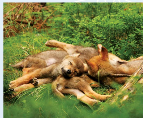
Spiace kľbo vlčat bolo odfotené v našej doline.